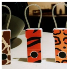
( ACM-Finger710A )

Sample : $ 9.90 100PC : $ 7.85 500PC : $ 7.05