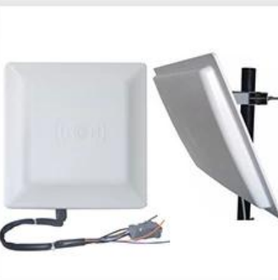
Long Distance UHF Reader