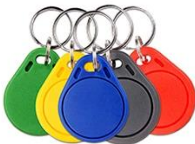
RFID Key fob