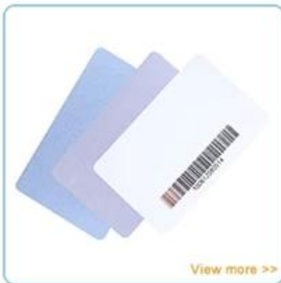
PVC ID card