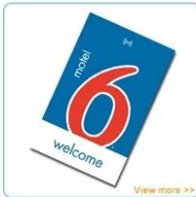
Hotel key card