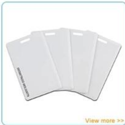
Access control card