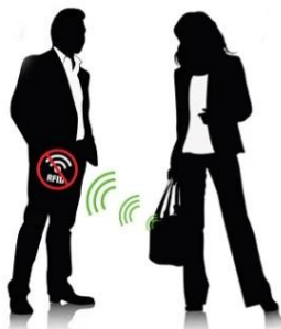
A hacker may carry around a concealed digital reader, scanning your personal info.

Criminals will be able to use scanners to steal your information within 3M.