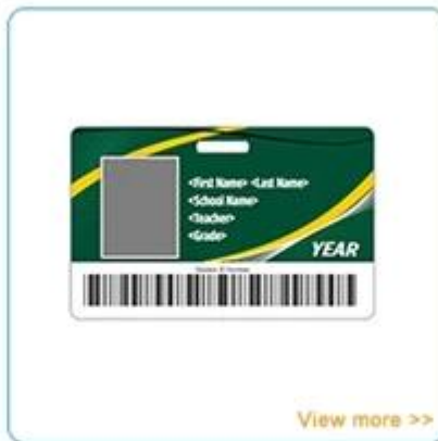
School ID card