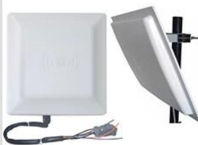
Long Distance UHF Reader