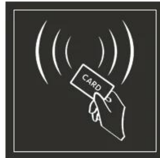
ID EM Cards