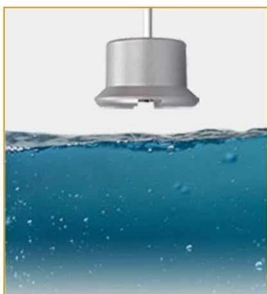
Normally Open Signal Installation Diagram

The normally closed signal is suitable for use in preventing water leakage. When the water submerges the contact of the flood detector, the detector outputs an alarm signal to the alarm host, and the host calls the user to notify the user after receiving the signal.