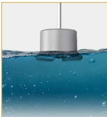
Normally Closed Signal Installation Diagram

You can choose the wiring method according to your needs