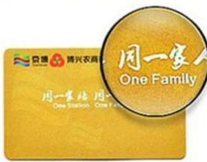
Hot Laser Silver