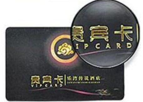
Hot Gold Lettering

We are Producing different RFID Smart Card with different code number