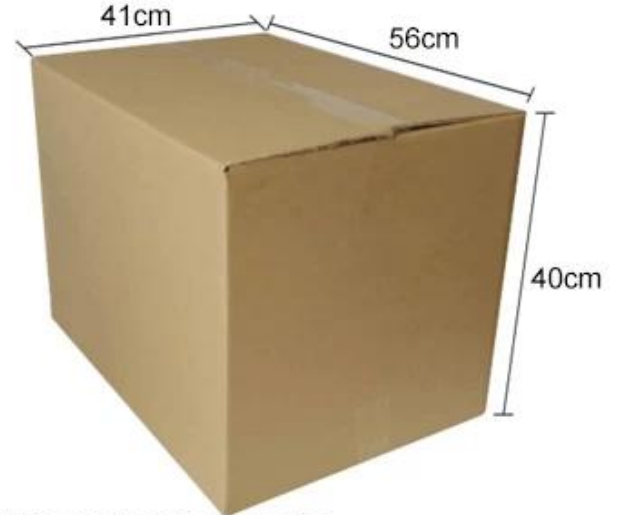
The product packing size