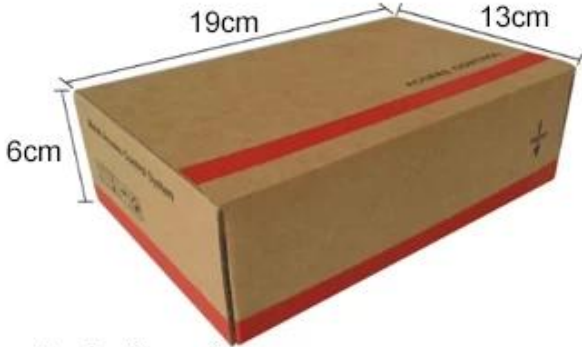
Product box size