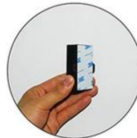
Stick it on the back of the Mini Controller