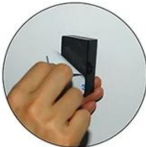
Rip the other side of the sticker