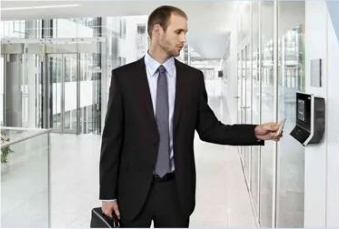
Access Control System