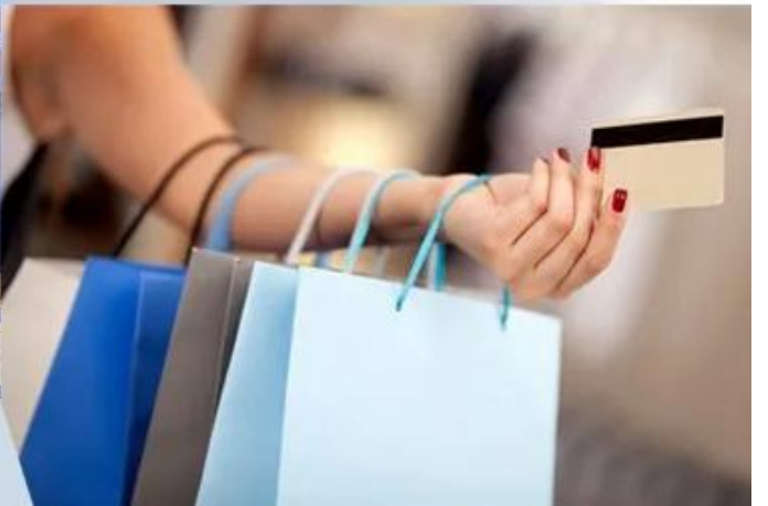
Magnetic Stripe Card