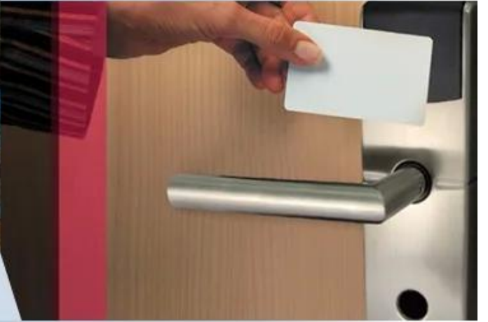
Hotel Card Application