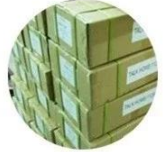
Outer carton package