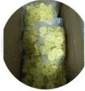
1000pcs per carton