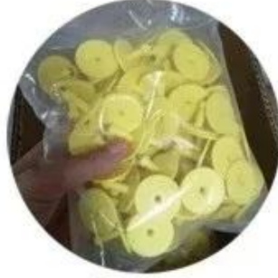
100pcs per bag