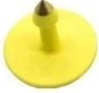
Rfid ear tag