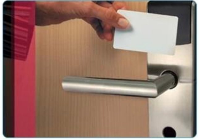
Hotel Card Application