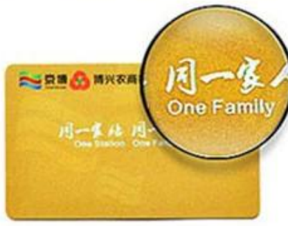
Hot Laser Silver