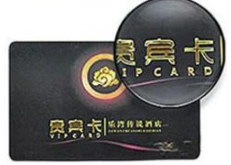
Hot Gold Lettering

We are Producing different RFID Smart Card with different code number