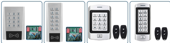
ACM-K7 ACM-S7 ACM-K8 ACM-S8