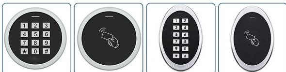
ACM-S99 ACM-M2 ACM-S5 ACM-S6