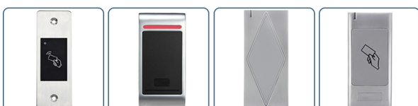
ACM-S99 ACM-M2 ACM-S5 ACM-S6