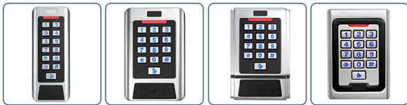
ACM-CC1 ACM-CC2 ACM-CC3 ACM-K5