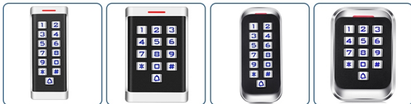
ACM-H1 ACM-H2 ACM-H3 ACM-H4