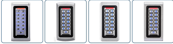
ACM-600 ACM-601 ACM-602 ACM-603