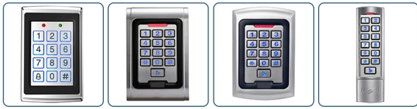
ACM-0103 ACM-100 ACM-500 ACM-N1