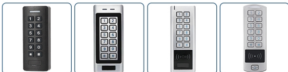
ACM-SK2 ACM-SK4 ACM-SK5 ACM-SK6-X