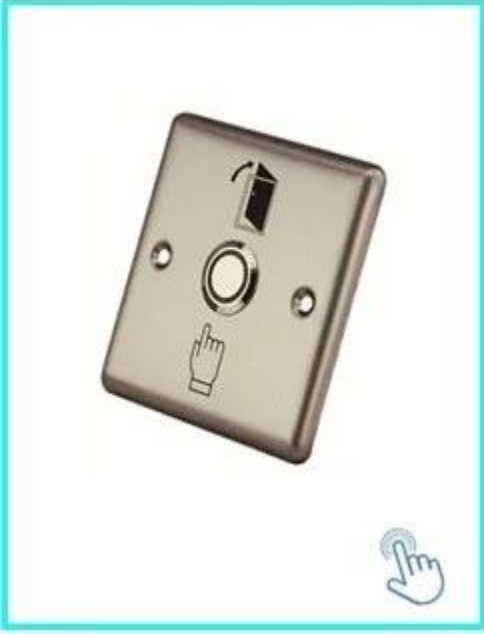
Dokunmadan Kapı Realese Çıkış Düğmesi K2B: 86 * 86mm