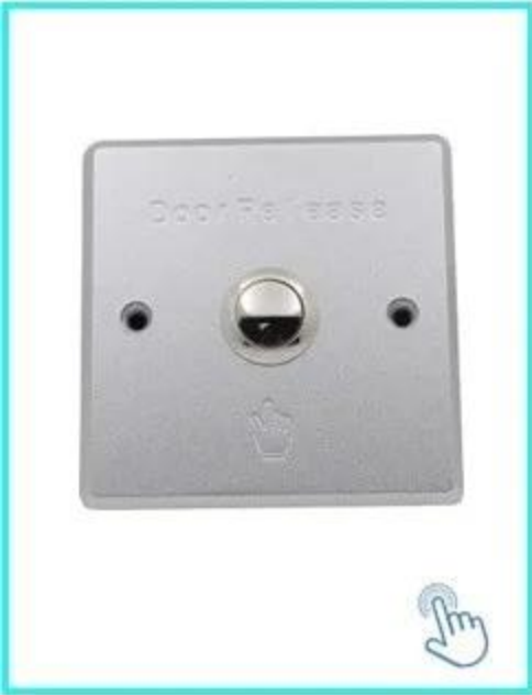
Kapı Açma Düğmesi, (Paslanmaz Çelik, NO / NC) K5B: 86 * 86mm